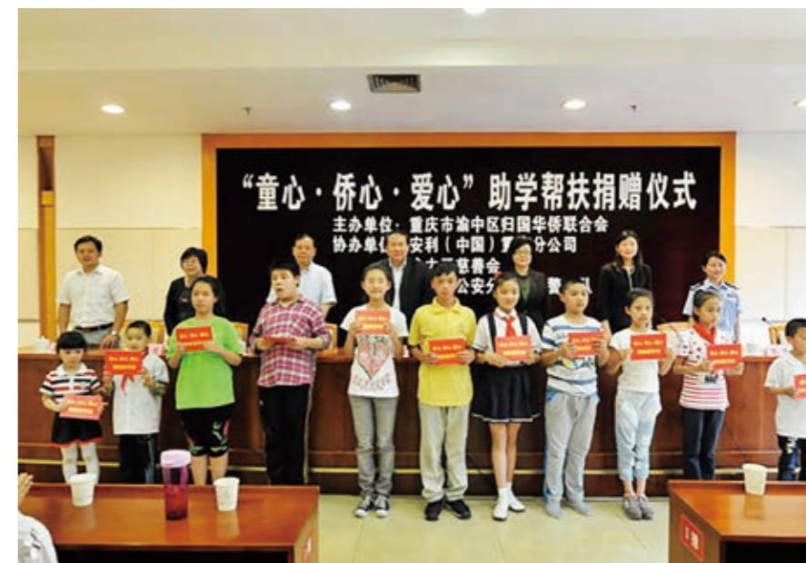
侨联开展助学帮扶捐赠活动