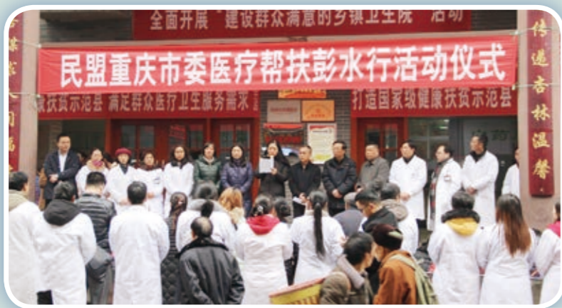
医疗帮扶彭水行活动仪式现场

1月17日一早，位于彭水苗族土家族自治县的郁山镇卫生院门前挤满村民，纯朴的脸上洋溢着兴奋和期待。民盟市委组织来自主城三甲医院的10多位医疗专家来到郁山镇卫生院进行义诊，让基层百姓在家门口享受高质量的医疗服务。今年的帮扶内容和形式除了现场诊治和义务咨询，还有疑难会诊、临床指导、专业讲座。这是民盟医疗专家第6次来到彭水苗族土家族自治县进行医疗帮扶。通过帮扶提高了基层医疗服务水平，实现了既“输血”又“造血”，为彭水早日完成脱贫工作增添了一份力量。