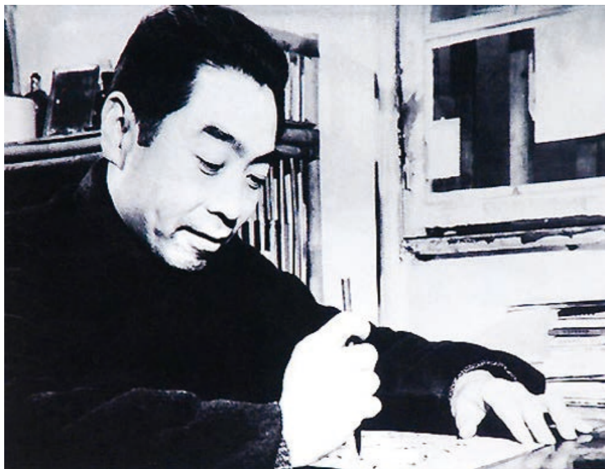
图为周恩来在重庆曾家岩50号办公

抗战时期，周恩来同志根据党的指示，领导中共代表团和中共中央南方局，日夜奋战在国民党统治区的战时首都重庆。他积极团结民主党派人士和各阶层人民，壮大了革命力量，巩固并发展了抗日民族统一战线，为中共的统战工作作出了巨大贡献。他率先垂范，求同存异，以情感人，以诚待人，以理服人，善于将党的方针政策与个人的人格魅力有机地结合起来，呈现出高超的统战艺术。