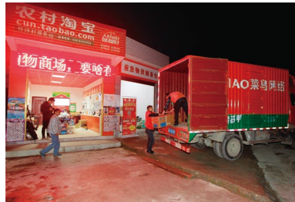
通过电商平台，奉节农产品销往全国各地

推动了产业发展。 随着“民企帮村”的深入推进，盘活农村4.8万亩撂荒土地，促进农村土地适度规模经营，助推农业农村改革全面深化，实现了全县特色效益农业茁壮成长。目前，全县围绕“1人1亩高效田、1户1个标准园”的目标，已发展32万亩脐橙、10万亩油橄榄、10万亩蔬菜、10万亩蚕桑、10万亩中药材、10万亩小水果，让80万农民拥有80万亩产业基地和80多类农特产品，总体形成“七分果、两分菜、一分药”的产业格局。