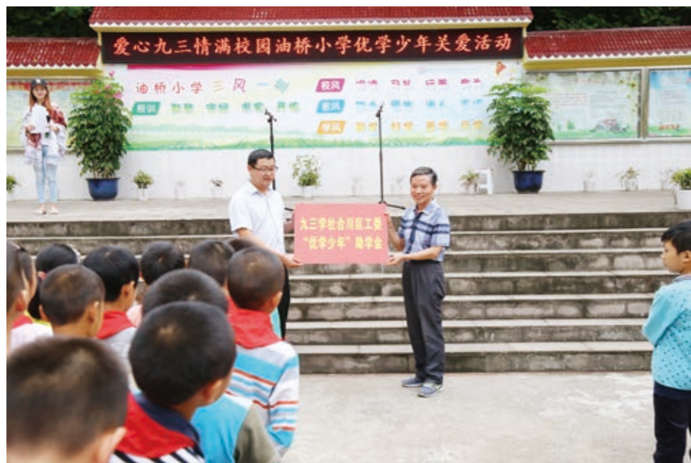
“六个一百”行动关爱贫困小学生

确保组织机构到位。 区委统战部牵头，整合系统单位、区教委、团区委、区民政局、区残联等单位力量，成立“六个一百”行动专项领导小组和六个行动小组。年初拟定并部署行动的主要内容、目标任务、开展方式等。每月定期收集活动开展情况，定期召开会议，总结工作，部署任务，督促行动。