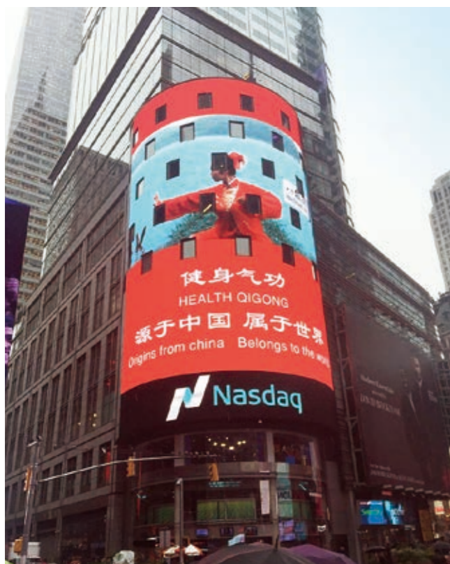
中国元素出现在纽约时代广场

话语权建设是新时代中国特色社会主义事业的重大课题。统一战线与中国话语权建设高度关联，处在话语权争夺的第一线，既是西方对我国实施话语霸权的集中指向领域和当前中国话语权建设的薄弱环节，又是中国话语权建设的重要力量、重要源泉、重要条件和重要保证。建设“话语中国”、解决“话语赤字”问题，离不开统一战线的启迪。加强中国话语权建设，要充分挖掘和运用融合中国道路、彰显中国方案、体现中国智慧、反映中国经验的统一战线资源，摒弃对统一战线的狭隘化、工具化、部门化认识，深入运用专业视角研究统一战线、运用统一战线视角研究中国，发挥统一战线在中国话语权建设中的重要作用，彰显统一战线话语价值。