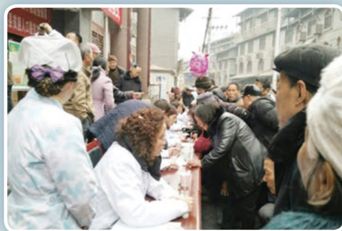
义诊现场人声鼎沸，人头攒动，乡亲们都很高兴主城的医疗专家来基层义诊咨询