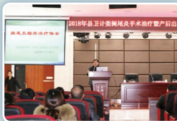
专家们为全县200余位医务工作者开展医疗专业讲座。