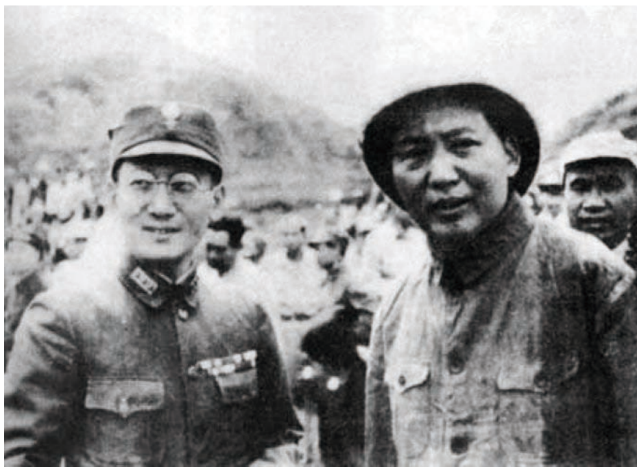
1945年10月11日毛泽东和张治中在延安机场

到十月十一日，我特送毛先生飞返延安。下飞机时，飞机场黑压压地站满了人。干部、群众、学生，男的、女的、老的、少的，在他