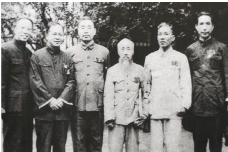
周恩来在重庆与沈钧儒等合影

武汉失守后，中共中央南方局迁到重庆，胡子昂有机会多次见到周恩来。一次，胡子昂到白象街出席工商界爱国人士座谈会，周恩来应邀来作报告，一进门就招呼胡子昂并对大家